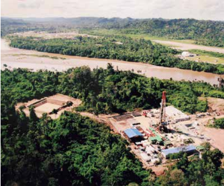
El inversionista analiza las ventajas de realizar un proyecto en costa o selva, de uno en el mar.