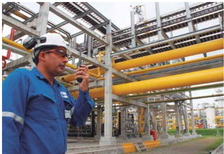
Muchos países miran tener una matriz energética que reduzca las emisiones de gases de efecto invernadero y emisiones de dióxido de carbono al medioambiente.

Hay proyectos que ya están explorando; por ejemplo, en la primera parte del año 2020, en el lote Z38 habrá una exploración realizada por un consorcio, que si sale bien sería el primer proyecto de aguas profundas que habría en el Perú.