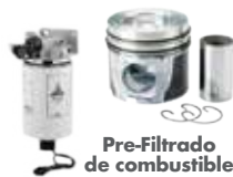
Pre-Filtrado de combustible DEUTZ